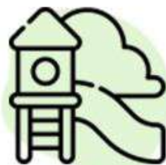
Площадка для игр