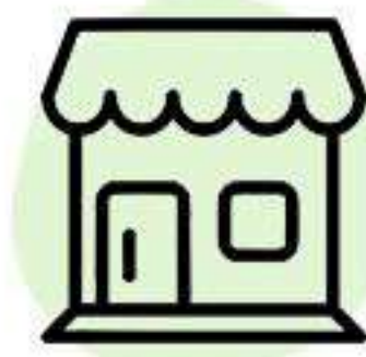
Территория под магазин